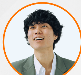
JAM株式会社 代表取締役